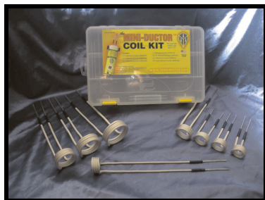
Sarja erikokoisia käämejä